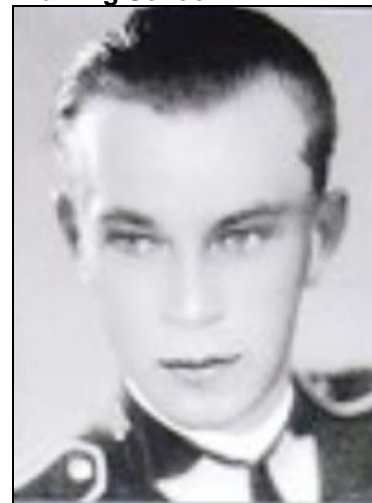
Velitel čsl. výsadkových jednotek v Itálii

Intrastitive Antropoid SILVER A, SILVER B, CLAY